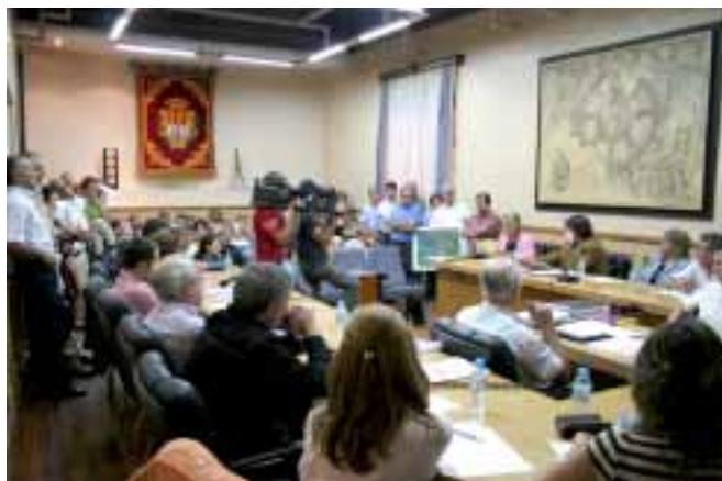
Lectura de la solicitud vecinal en el Pleno del 10 de octubre

Concedida la palabra a los Sres. Portavoces de los grupos municipales, por orden de menor a mayor representación, todos ellos exponen ampliamente su posición ante esta petición, exposición individualizada que por escrito se incorporará también al expediente de la sesión, si bien las posturas definitivas y concretas son las siguientes: El Grupo de Izquierda Unida, a favor de la solicitud vecinal y, por tanto, del cambio de trazado de la Variante; los grupos de Chunta Aragonesista, Partido Aragonés, Partido Socialista y Partido Popular, en contra en estos momentos de promover el cambio de trazado. Todo ello, en concreta votación, con el resultado de 2 votos a favor y 15 en contra, por lo que la Presidencia declara rechazado el contenido de la petición vecinal presentada.