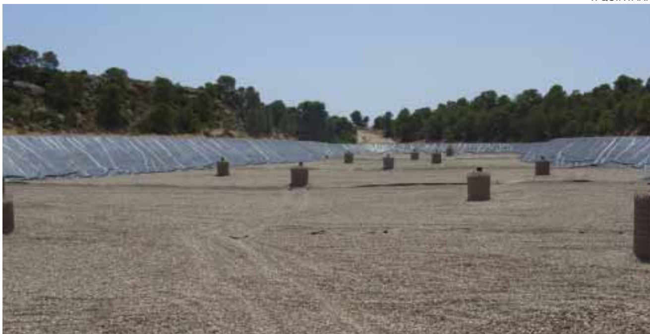
Imagen de una parte de las instalaciones del nuevo vertedero supracomarcal de la Agrupación 7

El vertedero de residuos sólidos urbanos de la Agrupación 7, ubicado en Alcañiz, en la zona del Corral de las Vacas y accesible desde la carretera N-211 (Alcañiz-Caspe), está en funcionamiento desde finales de septiembre. El equipamiento medioambiental da servicio a unos 70000 ciudadanos de 61 municipios de cinco comarcas: Andorra-Sierra de Arcos, Bajo Aragón, Bajo Aragón-Caspe/Baix Aragó-Casp, Bajo Martín y Matarraña/Matarranya. Con la puesta en marcha de la infraestructura se han iniciado también los trámites para el sellado del antiguo vertedero alcañizano, situado en las inmediaciones del Cabezo del Cuervo; los vecinos que hasta ahora llevaban allí los Residuos Sólidos Urbanos deben depositarlos ya en el nuevo vertedero.