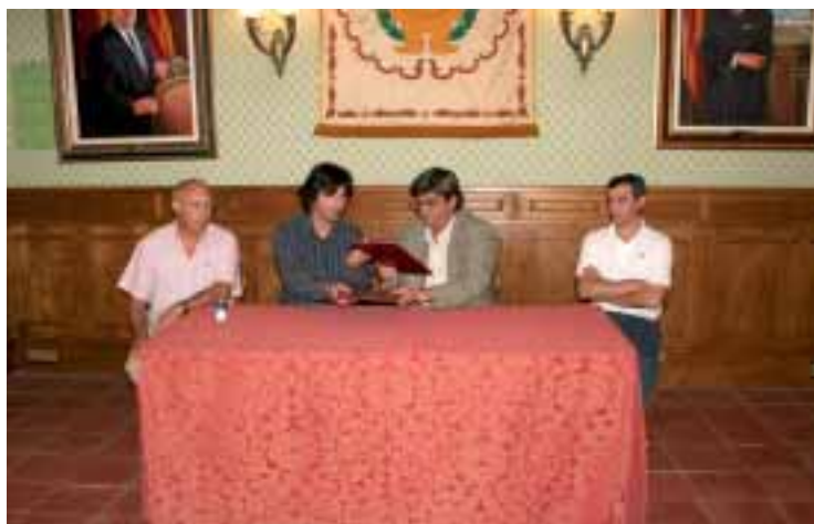
Imagen de la firma del convenio, el 26 de septiembre pasado

SÉPTIMA.- El presente Convenio tiene naturaleza administrativa. Para la resolución de los problemas de interpretación, cumplimiento y ejecución del presente Convenio, las partes se someterán de acuerdo al Orden Jurisdiccional Contencioso-Administrativo.