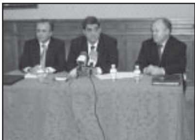
Firma del convenio con la CAI