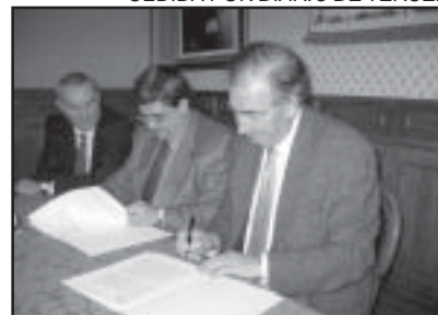
Firma del convenio con IberCaja