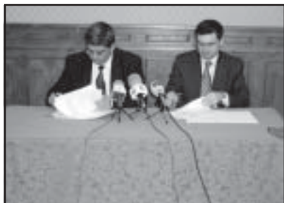
Firma del convenio con la Caja Rural