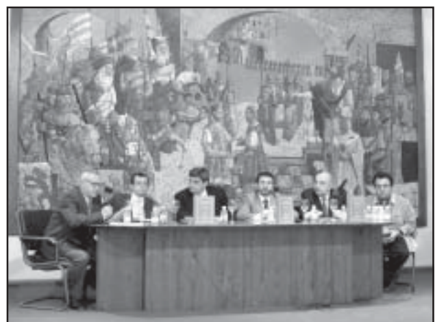
Presentación en Benavente (Zamora) de Adagios y Fábulas