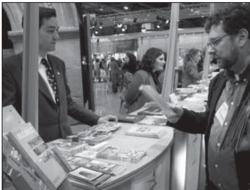
Imagen de la parte dedicada a Alcañiz en el stand de Aragón, en Fitur 2003

Alcañiz ha estado representado del 29 de enero al 2 de febrero en la Feria Internacional de Turismo de Madrid, Fitur 2003, a través de la presencia activa, en el certamen, de la Oficina de Turismo del Ayuntamiento -como parte del stand de la Comunidad de Aragón- y de representantes municipales. El informe elaborado por la Oficina revela que durante los días de la Feria, los visitantes demandaron, entre otros, 2.500 impresos de información ge-