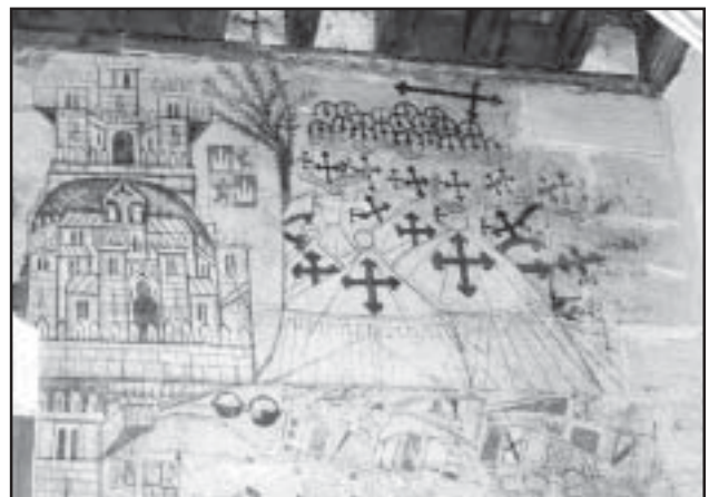
Caballeros de la Orden de Calatrava en las pinturas del Castillo

Es ahora cuando “los nuevos calatravos”, los administradores actuales de esta propiedad del Estado, manifiestan su intención de “normar lo que ha venido siendo una situación de colaboración fruto de las relaciones de buena vecindad”. Da la sensación de que las relaciones han dejado de ser de buena vecindad, ya que se pretenden pactar otras normas. Para ello se confecciona un borrador de convenio en el que el primer punto se resalta la total propiedad del terreno y edificios del Castillo, hasta sus límites con el parque que le rodea. Mal empezamos; y mal acabamos cuando se pretenden poner condiciones para el uso, por parte del Ayuntamiento, de la zona no afectada por el Parador. Estas condiciones se parecen mucho a las que pone un dueño a un siervo.