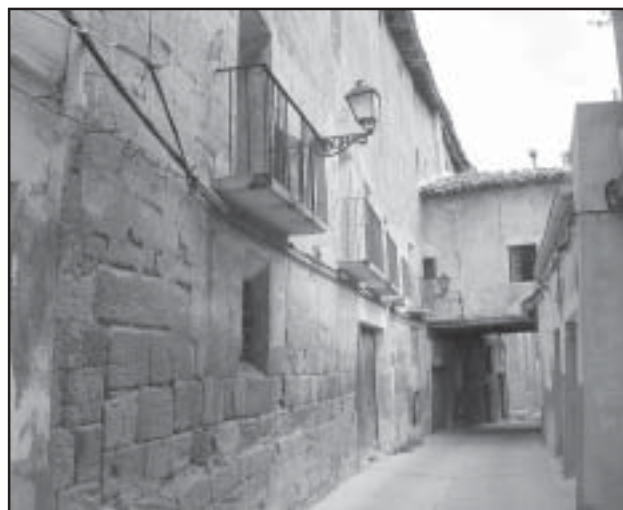
Las rehabilitaciones en el Casco Histórico, bonificadas en el 2003

Esperamos que esta medida de reducción impositiva sea un aliciente más para la recuperación de nuestro casco histórico.