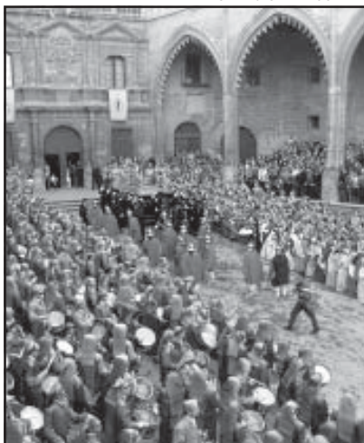
La Plaza de España, escenario destacado