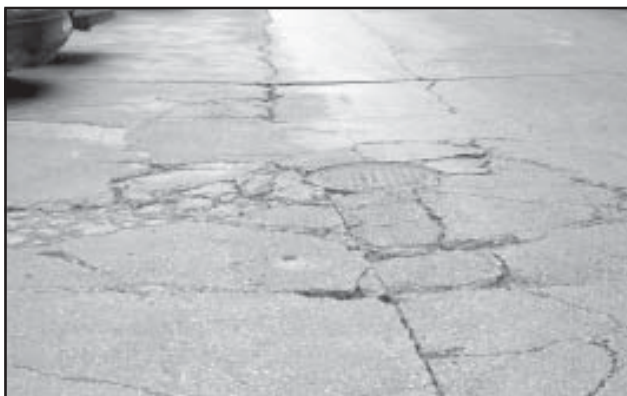
Socavón en la calle Ciudad Deportiva de Santa María

Es comentario unánime que muchas de nuestras calles necesitan desde una reforma integral a un asfaltado urgente. Hay en estos momentos algunas de ellas (véase por ejemplo la calle Ciudad Deportiva de Santa María) que requieren de gran pericia por parte de peatones y de conductores. Lo que antaño fueron baches, hoy son auténticos socavones. Algunas aceras están hundidas o tienen algún agujero. Meter el pie y torcerse un tobillo es más que sencillo. Por esa zona de aceras estrechas, sin bordillos, sin un tráfico ni aparcamiento regulado, el Ayuntamiento no está dando el servicio que el barrio y una Ciudad como la nuestra en su conjunto deberían tener.