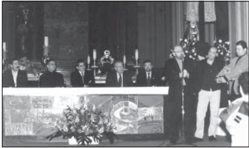
El Pregonero y la Presidencia, durante la concesión del premio Redoble