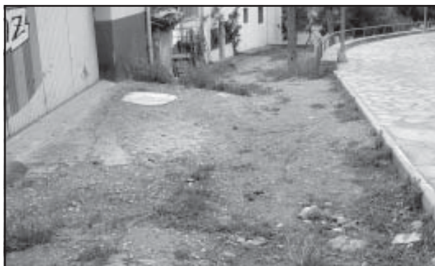
Los jardines de la Ronda Calatravos necesitan reformas

Sabemos que nuestra ciudad necesita muchas otras actuaciones y reformas. Todas y cada una de ellas están en nuestro archivo, y sobre muchas de ellas existen compromisos de mejora que esperamos que el Gobierno cumpla, dando satisfacción a los Ciudadanos, y asumiendo un deber político con quienes le dieron el visto bueno a su presupuesto.