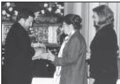
El Tambor Noble, para el Silencio