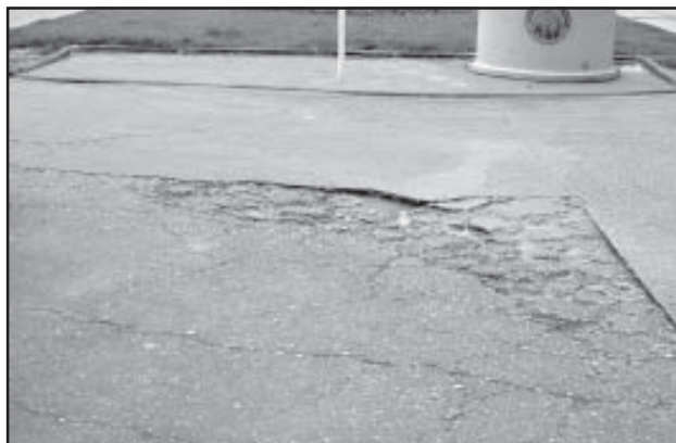
Estado del pavimento en la c/ Belmonte de San José

zonas que perjudican gravemente el tránsito. Queremos terminar con el peligro que entraña la subida y bajada de turismos en la intersección con otras calles. La señalización también es deficiente.