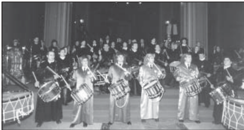
La Excolegiata de Santa María la Mayor acogió numerosos actos