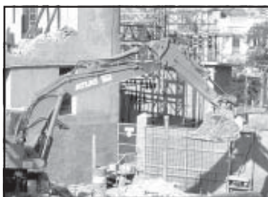
Las reformas urbanas, incluidas

En el apartado de Ingresos, el Presupuesto del Ayuntamiento de Alcañiz para este año contempla 6.800.000 € procedentes de Ope-