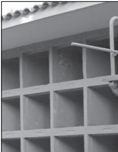
Nuevos nichos del Cementerio

La Comisión de Gobierno del Ayuntamiento acordó por unanimidad, el pasado 18 de enero, adjudicar definitivamente a la empresa Multiasistencia Servial, S.L. la obra de construcción de 160 nichos en el Cementerio Municipal. El importe de la adjudicación, a la cual optaban tres empresas, es de 57.096,15 euros, IVA incluido. El proceso adjudicatorio se llevó a cabo mediante procedimiento abierto y subasta de tramitación ordinaria, con publicidad a través de anuncio insertado en el Boletín Oficial de la Provincia de Teruel.